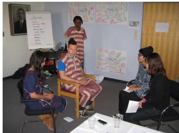
Studenten von AIESEC bei einem Workshop

eine theaterpädagogische Reise nach Afrika. Im November präsentierten wir uns in einer Veranstaltungsreihe der Konrad-Adenauer-Stiftung im Rahmen der Reihe „Globale Welt - globale Aufgaben, Herausforderungen der Entwicklungspolitik“ im Stadtmuseum Dresden zum Thema Wofür soll man spenden? .