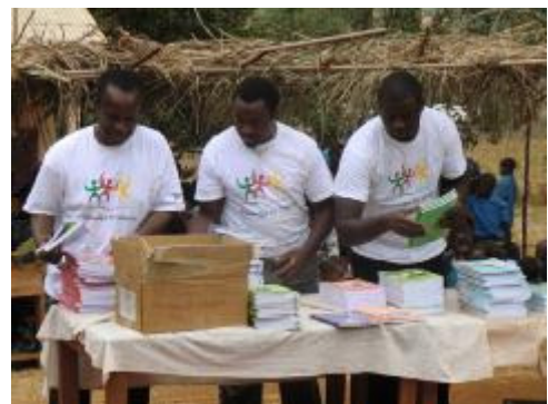
KforC Mitarbeiter bei der Übergabe von Schulbüchern für eine Schule

Knowledge for Children setzt sich seit Jahren für die Förderung einer unterstützenden Lernumgebung ein.