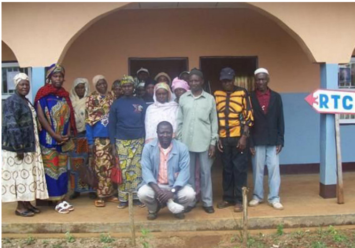
Treffen der Bauern im Trainingszentrum August 2012

Ein gutes Jahr hat es gedauert bis das Projekt zur Errichtung eines Schulungsgebäudes und eines Gästehauses in Kooperation mit der Sharon Farmers Group und gefördert durch das Bundesministerium für wirtschaftliche Zusammenarbeit und Entwicklung (BMZ) erfolgreich abgeschlossen werden konnte. Im April fand die feierliche Einweihung des Trainingszentrums statt und seitdem haben schon einige Seminare für lokale Bauern wie auch ausländische Studenten stattfinden können.