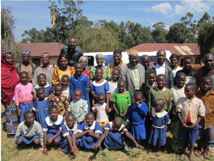
Neue Stipendiaten und ihre Mütter in Memfu

trag von ca. 665 Euro ins neue Schuljahr mitzunehmen und dann neue Stipendiaten aufzunehmen.