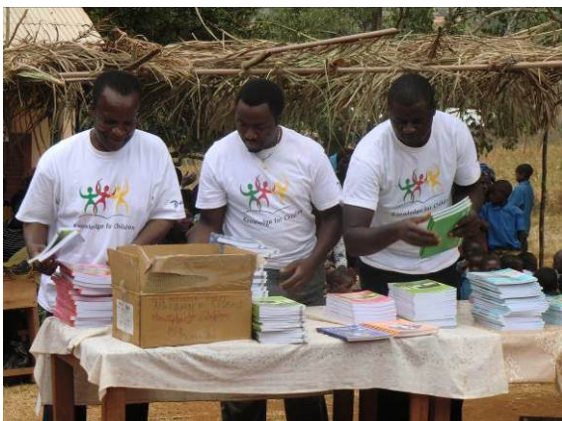
Mitarbeiter von KforC bei der Buchübergabe

Auch 2014 stehen wieder viele Höhepunkte an, zum Beispiel werden wir wieder neue Projekte in Angriff nehmen, Sie auf unsere erweiterte Mitgliederversammlung