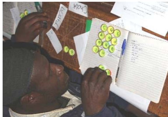
Lehrer beim Herstellen von interaktivem Unterrichtsmaterial in einem Workshop

Nachdem die ersten Schulungen schon im Oktober 2014 stattgefunden hatten, wurden nun Lehrer und Lehrerinnen von 7 Schulen intensiv gecoacht. Die Mitarbeiter von Knowledge for Children , dem ausführenden Partner vor Ort, hospitierten in den Unterrichtsstunden der einzelnen Lehrkräfte und gaben dann ein konstruktives Feedback. Nach einigen Wochen kehr-