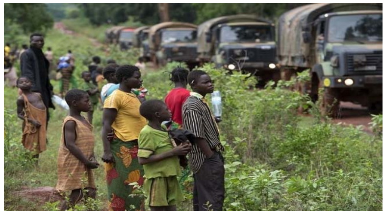
Abb. 2: Einrücken des Militärs im Südwesten

dächtige, wie uns Augenzeugen berichten, nicht mehr nur verhaftet, sondern ohne Anklage hingerichtet. Die Brutalität, die dieser Konflikt im Moment annimmt ist für uns nur schwer zu ertragen. Viele haben das Konfliktgebiet verlassen und sind auf der Flucht.