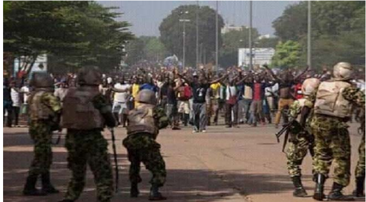
Abb. 1: Konter des Militärs auf die Proteste im anglo-phonen Kamerun ( www.cameroonconcordnews.com )

Unser Jahresbericht 2018 fällt leider recht kurz aus. Hatten wir Anfang des Jahres noch auf eine Entspannung des Konflikts gehofft, spitzte sich dieser mit der Präsidentschaftswahl am 07. Oktober noch zu. Lesen Sie mehr zum aktuellen Status im ersten Punkt des Berichts.